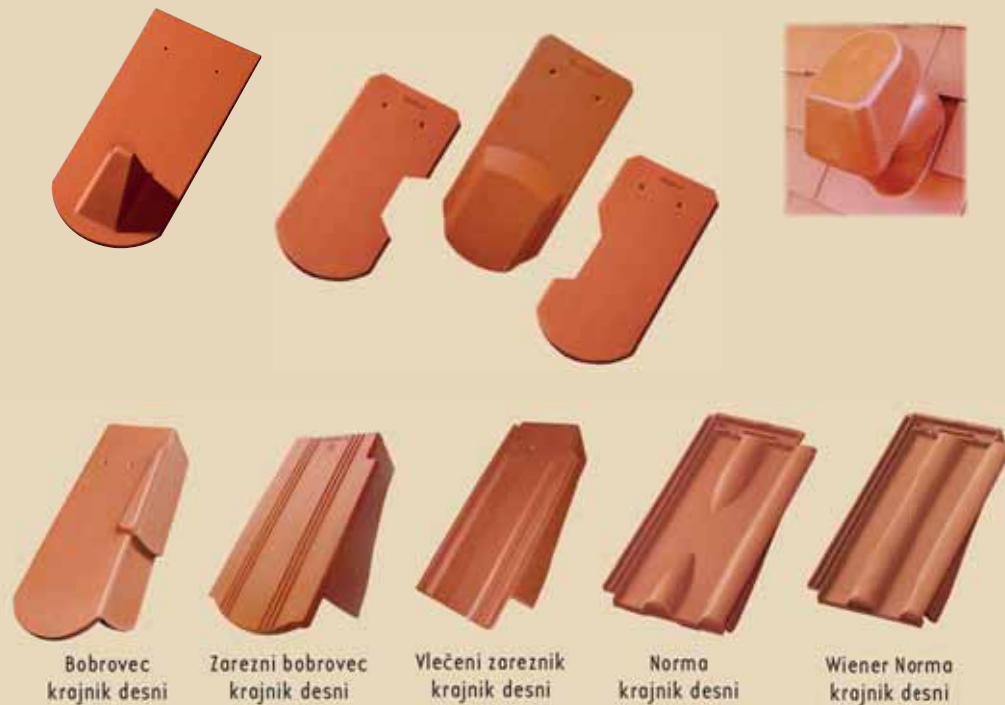
Bobrovec krajnik desni Zarezni bobrovec krajnik desni Vlečeni zareznik krajnik desni Norma krajnik desni Wiener Norma krajnik desni

Opečni krajniki nadomeščajo izvedbo klasičnega zaključka strehe iz pločevine. Tako damo strehi še en detajl, kar jo naredi še lepšo.